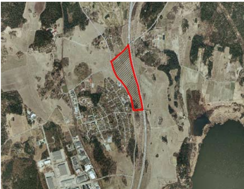
Sigtuna kommun har köpt mark mellan E4 och norra delen av Rosersbergs samhälle.

Dessutom krävs att tillståndet ska bygga på så kallade kurvade inflygningar, vilket gör att man kan undvika tätorter bättre vid in- och utflygningar framöver. Dessutom vill partiet att "natt" ska råda fram till kl. 07 och inte till kl. 06 som LFV föreslår.