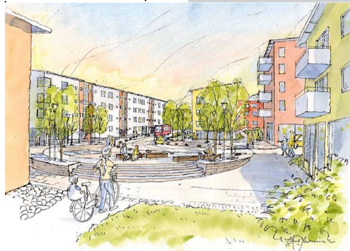
Illustration: Stadsbyggnadskontoret/ Fokus Arkitektur AB